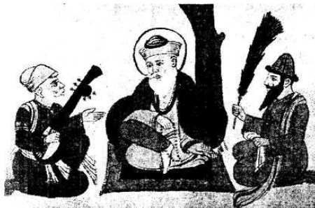
Гуру Нанак с учениками. Старинная рукопись

Видно, что стеллиум планет в гороскопе великого гуру попадает в IX дом гороскопа, говорящий о религиозности и духовной жизни человека. В таком случае Юпитер оказывается в III доме гороскопа и между домами учительства и ученичества устанавливается связь. Прежде чем стать учителем, человек должен пройти долгий путь ученичества, и гуру Нанак этот путь прошел, долго учась у браминов и суфиев. Создав собственное религиозно-этическое учение, он стал учителем — «гуру», а все его последователи стали учениками — «сикхами».