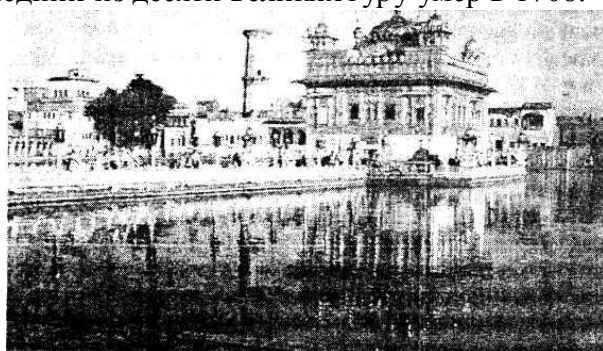
Золотой храм сикхов.

Нанак, открывший своим последователям учение о святости Наставника, ведущего человека в его поисках истины, сам стал первым Гуру. Тем не менее, сам Нанак никогда не считался воплощением Бога, единственного и истинного Гуру. Отношения между учителем и учеником рассматриваются сикхами как единственно верный путь передачи божественного знания. Отличительной чертой сикхизма как религии гуру является то, что сам Нанак и 9 его последователей почитаются как создатели эпохи живых гуру, обладавших общей индивидуальностью и одинаковой способностью проникновения в Бога. Сикхи считают, что десять гуру подобны десяти свечам, зажженным одна от другой. Гуру Нанак родился в 1496 году, а последний из десяти великих гуру умер в 1708.