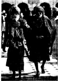
Сикхи. Золотой храм сикхов. Престол Гуру Грантх

Гуру Нанак заложил основы удивительно крепкой общины, религиозные и мировоззренческие взгляды которой не претерпели никаких изменений по сей день.